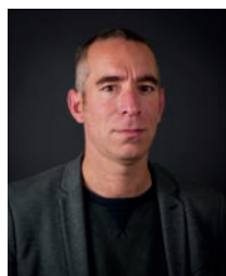
Olivier Ferry Patrimoine bâti