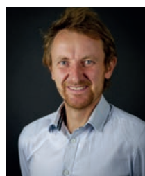
Guillaume Piard Espaces publics et Mobilités