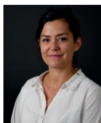
Marine Couturier Attractivité et de la qualité de vie